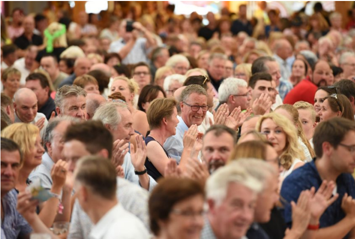
Volle Tische bei der Eröffnungsfeier.