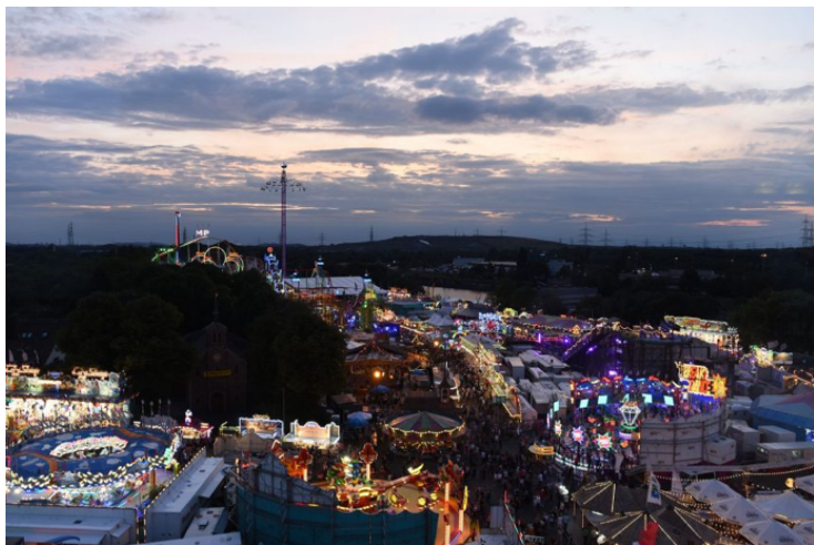
Impressionen der 535. Crange Kirmes 2019